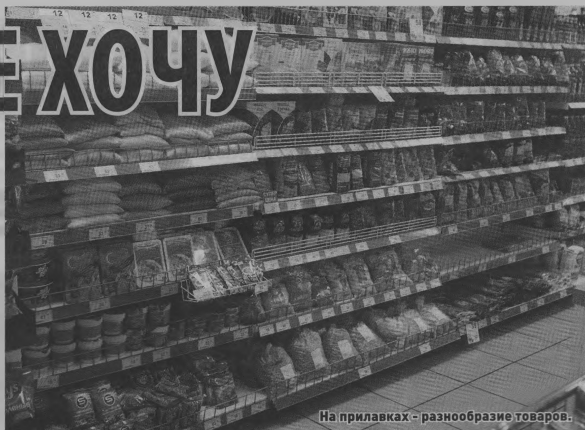
На прилавках - разнообразие товаров.