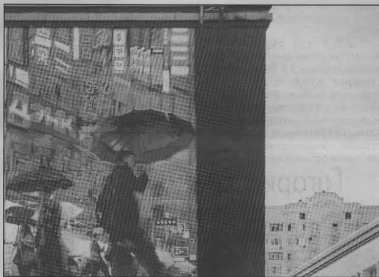
«Стрит-арт на улицах города.

За последние годы в Нижнем появилось более 50 новых стрит-арт работ. Среди наиболее выдающихся - проект Покрыса Лампаса и Андрея Бергера, которые расписали здание концертного зала «Юпитер». На улице Варварской расположился монументальный проект стрит-арт художника LexusOne, изображающий Максима Горького. Ещё одна