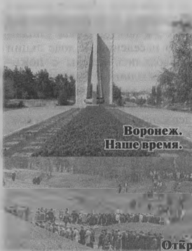
Воронеж. Наше время.

Когда советские войска освободили Воронеж, возвратилась она в город и рассказала о том, что произошло в Песчаном Логу. Теперь она ехала, чтобы указать место. Три дня раскопок, сотни трупов, из них тридцать пять детей. Опознавали их родные и близкие по разным предметам. В ходе раскопок было извлечено около пятисот трупов. По опознанию и документам установлено сто шестьдесят девять имен, из них сто трид-