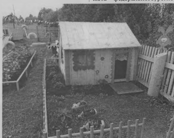
◆ Территория детского сада «Василек» в Кувербе.

Аналогичная ситуация: везде старались что-то сделать: красили, ремонтировали и даже строили. Можно