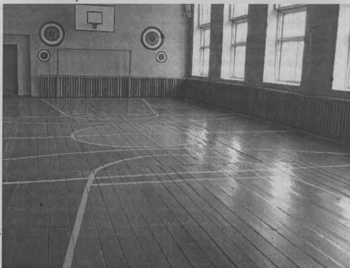
◆ Спортзал Гагаринской школы.