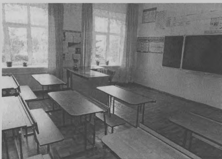
◆ Уютный класс Пижемской школы.

Также была проведена замена оконных блоков: в ка-