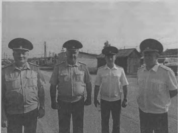
◆ Офицеры, офицеры...