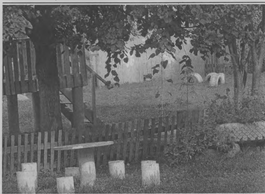
◆ Все - для удобства детей.