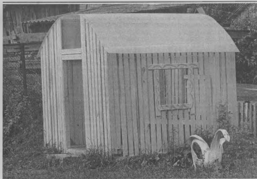
◆ Папы построили домик.