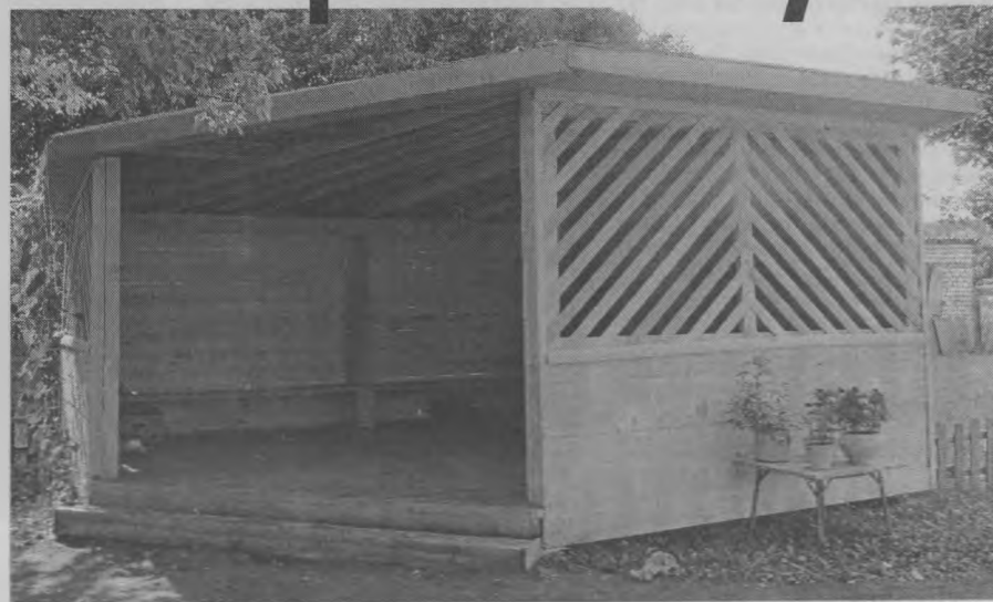
◆ Веранда для средней группы.

Подходит к концу тихий час – и детвора снова заполнит территорию, где царят красота и уют, любовно созданные руками работников детского сада и родителей.