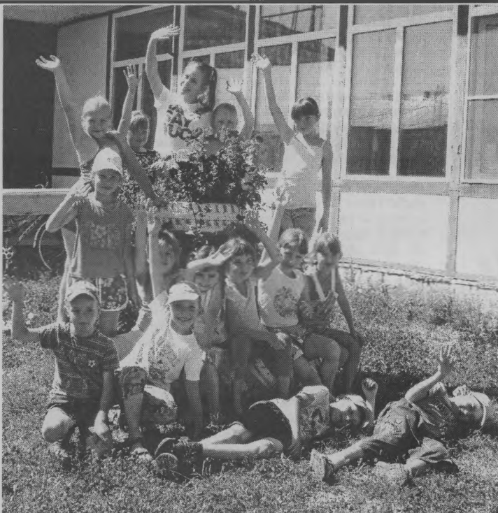
◆ Вместе отдыхать веселее!

Работая с детьми, мы старались в каждом ребенке разглядеть свою изюминку и по окон-