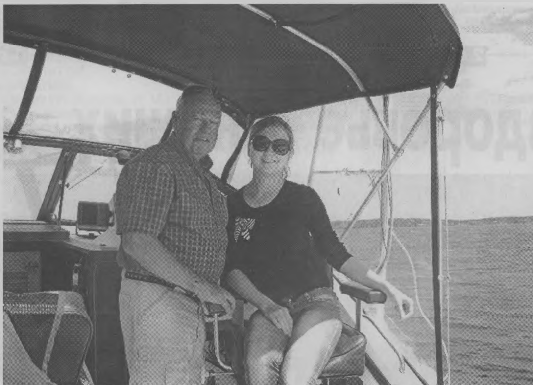
◆ В далекой Америке.

Когда один из моих друзей спросил меня: «А какие они, американцы? Есть ли в них