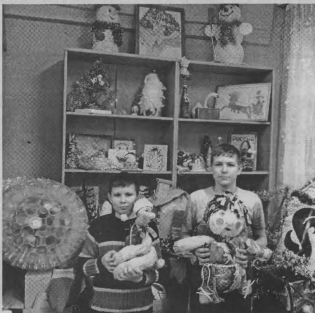
◆ Игрушки для главной елки района.