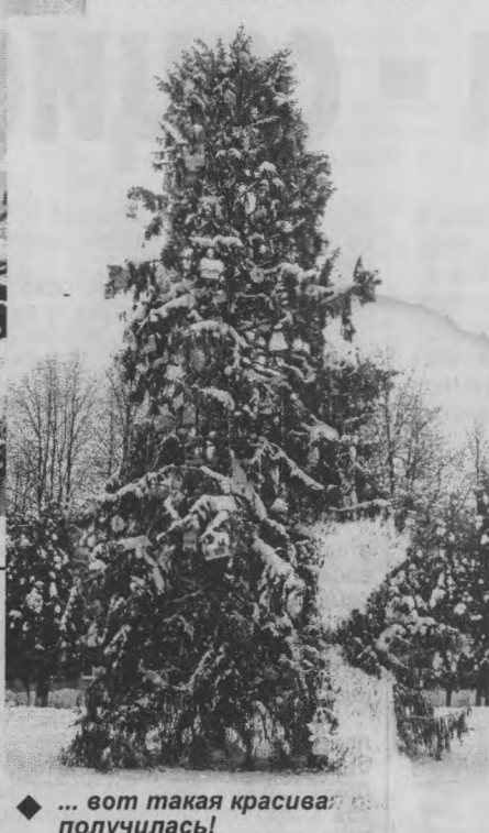
◆ ... вот такая красавица получилась!

В новогодние дни глазная елка района сияла праздничными огнями и радовала всех своим прекрасным видом.