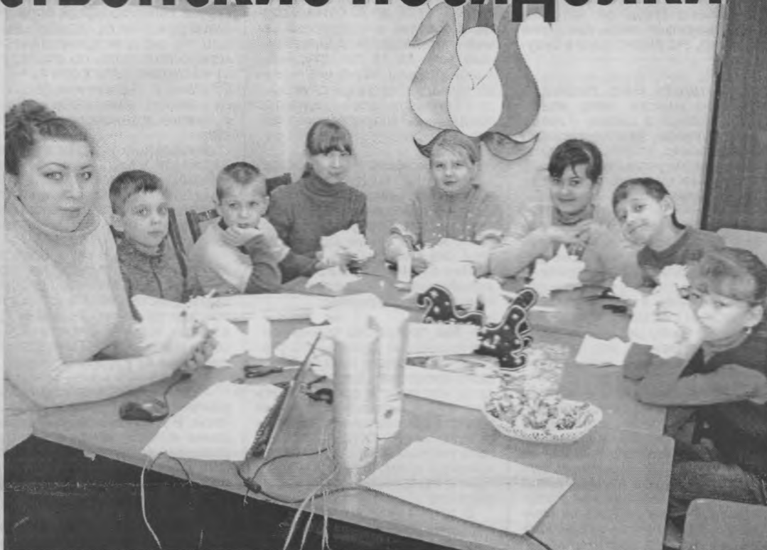
◆ Посидим, потворим, почаевничаем.

Дети получили много интересной информации и положительные эмоции.