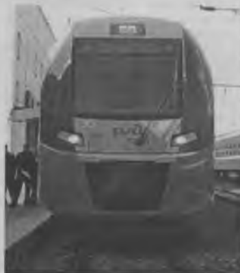
раживание рециркуляционного воздуха осуществляется при помощи ультрафиолетового излучения. ИА «Время Н».