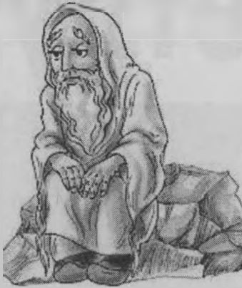
говорит садовник. - Пойдёмте к нему!

Братья и детям и внукам своим потом рассказывали о хитрых подарках мудрого старика и всем завещали беречь своё здоровье, как самое дорогое, что даётся человеку.