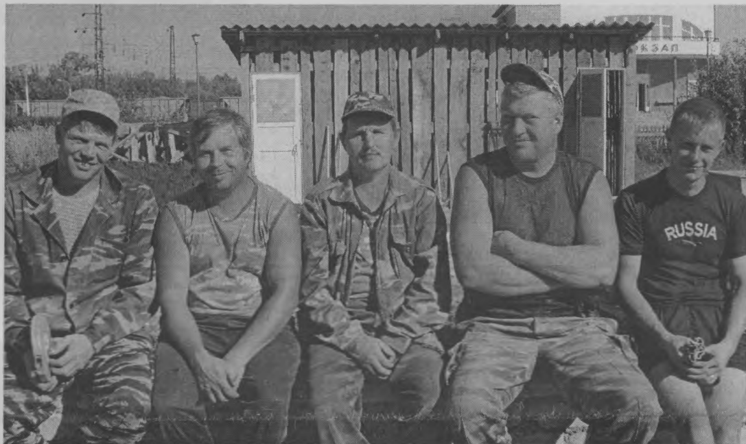
◆ Если дело спорится - и настроение хорошее.