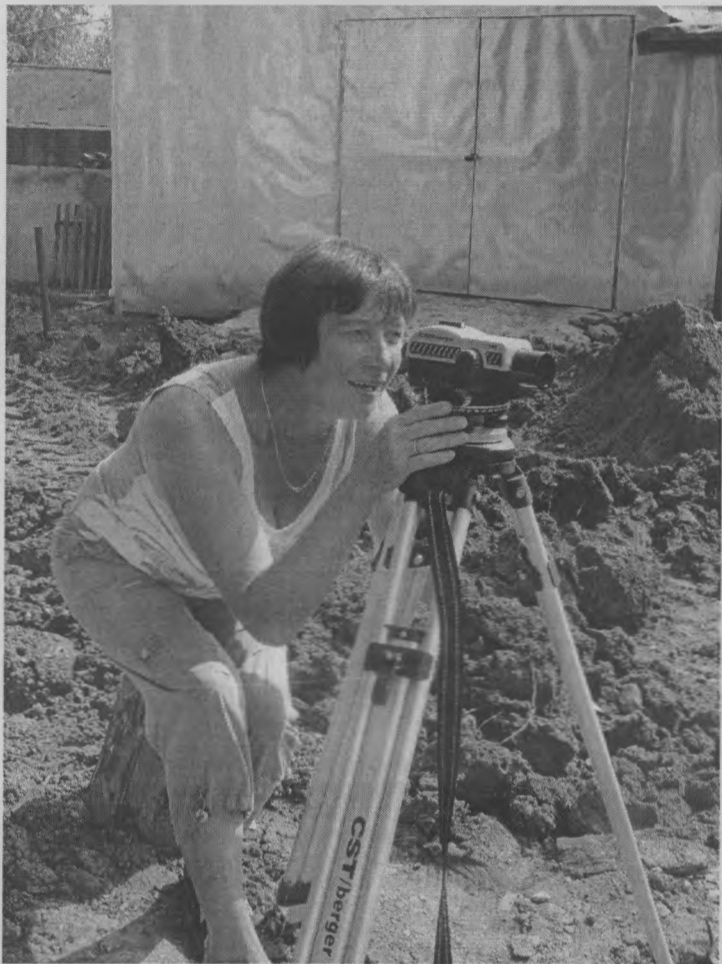
◆ Проверим уровень уклона...

Строительство очистных имеет продолжительную историю. Работы велись с переменным успехом. Понятно, что каждый раз вопрос продолжения строительства упирался в финансирование. Объект крайне необходимый для поселка – это очевидно уже много лет. И нынче благодаря настойчивости главы райадминистрации работы на очистных возобновились. Это заметили жители улицы Центральной. В настоящее время бригада работает за зданием суда.