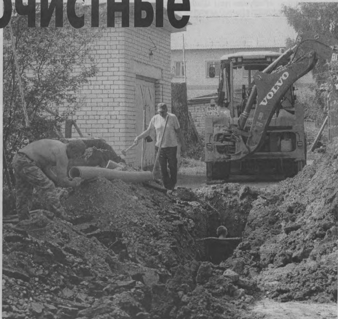
◆ Бригада выполняет подводку.