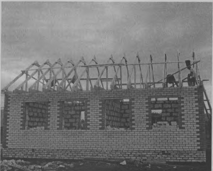
◆ Дом - под крышу.