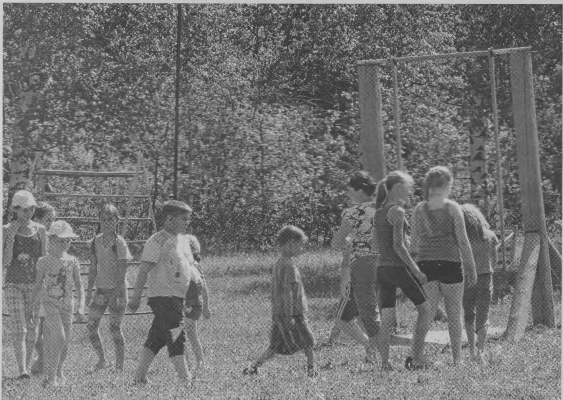
◆ Во время занятий.

вали дерево добра. Дети получили много интересной и полезной информации из бесед о правильном питании, о вредных привычках, о здоровом образе жизни.