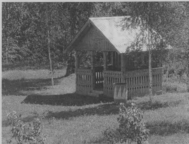
◆ Уютная беседка.

Если за окном было пасмурно и дождливо, занятия проводились в помещении. И тоже было интересно: мастерили игольницы, аппликации, рисо-