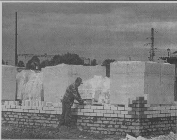
◆ Кладка стен.