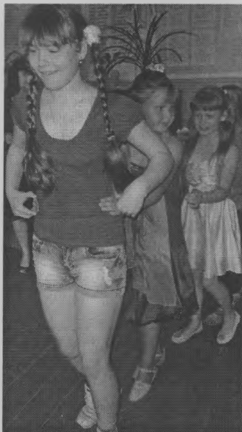
◆ «Веселая эстафета».

Четырнадцать дней смены вместили в себя «День России», «День умников и умниц», «День талантов»,