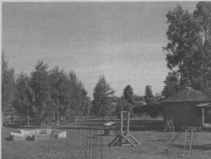
◆ Детская площадка.