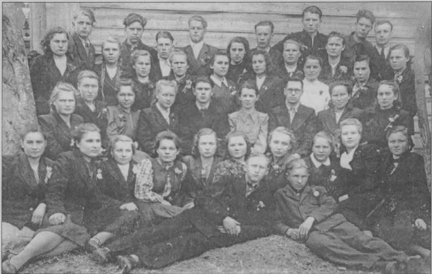
◆ Выпуск 1962 года.

«Миллион – Родине» – под таким девизом проходила в школе всесоюзная операция по сбору макулатуры. Около трёх тонн собрали школьники. Некогда сумма из денег, полученных за это вторичное сырьё, была перечислена в фонд по-