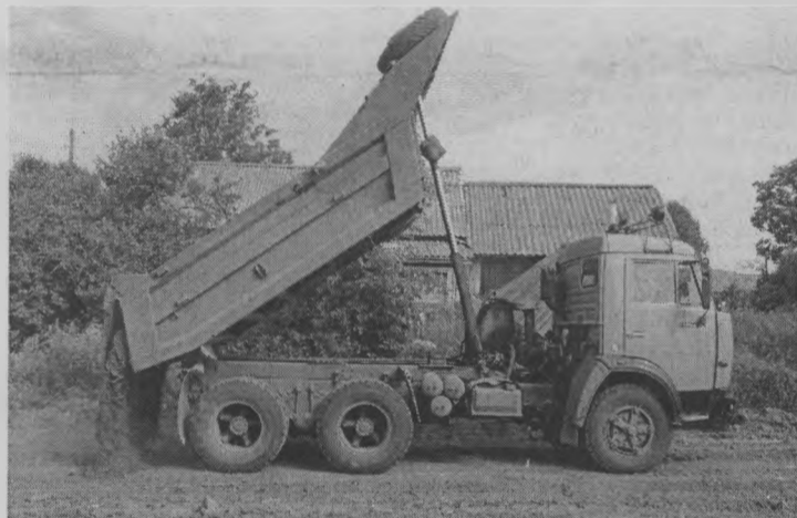
◆ С почином!