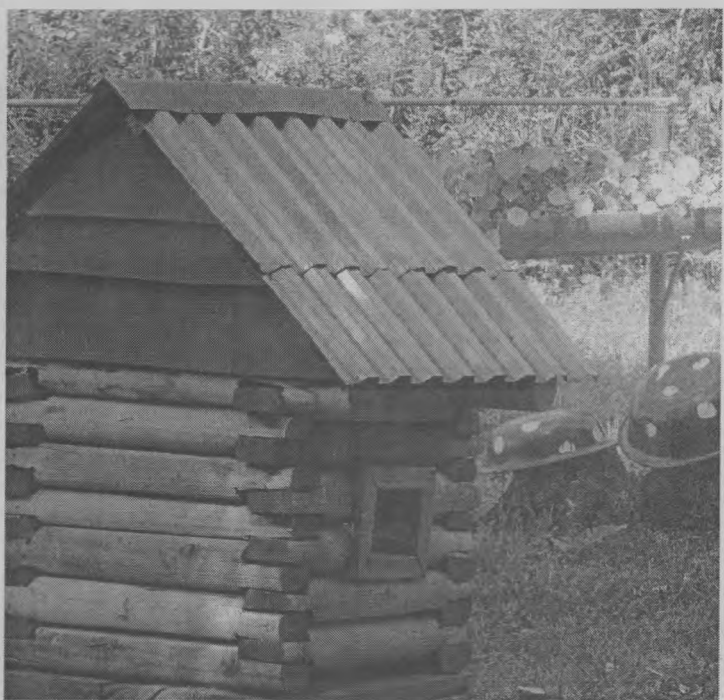
◆ Избушка сказочная...