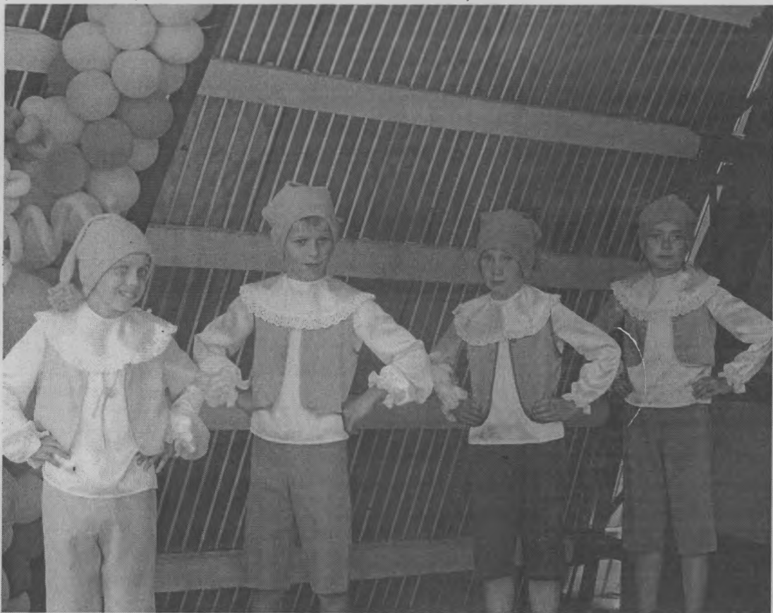
◆ Выступают гномы.

сти. А в 2011 году лагерь стал победителем конкурса и получил грант в 50 тыс. рублей. Лагерь живет и с оптимизмом смотрит в будущее. Это видно и по настроению детей: такие улыбки, глаза блестят, бойкие, активные! А с каким азартом они участвовали в праздничном мероприятии, посвященном 20-летию лагеря! И пели, и танцевали – группами и все вместе.