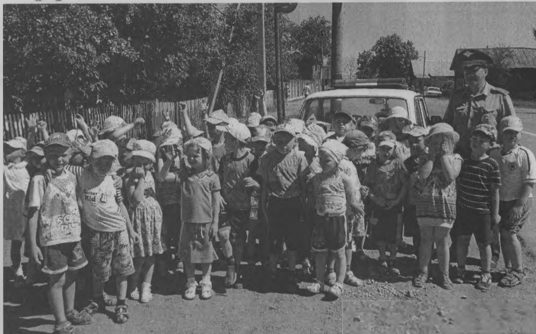
«Мы узнали много интересного!».

В нашем детском саду № 2 «Колосок» прошла неделя безопасности дорожного движения «Добрая дорога детства».