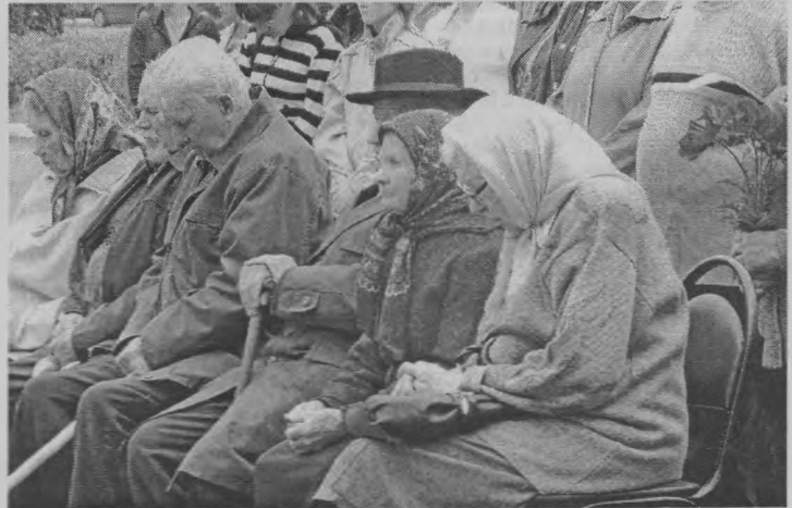
◆ В скорбном молчании.

На площади Мира в Тоншаево состоялся митинг, посвященный Дню памяти и скорби.