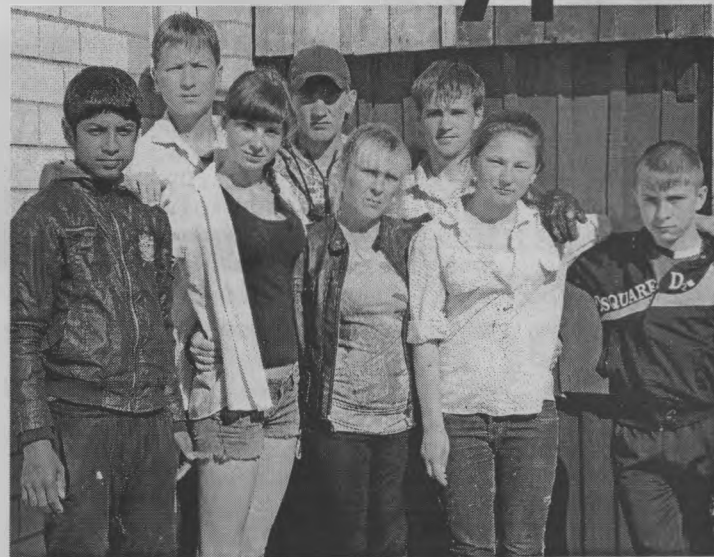
◆ Дружные, старательные ребята.

ем уха» слышали наш диалог и еще старательнее растирали кистью зеленую краску по стенам крыльчeka.