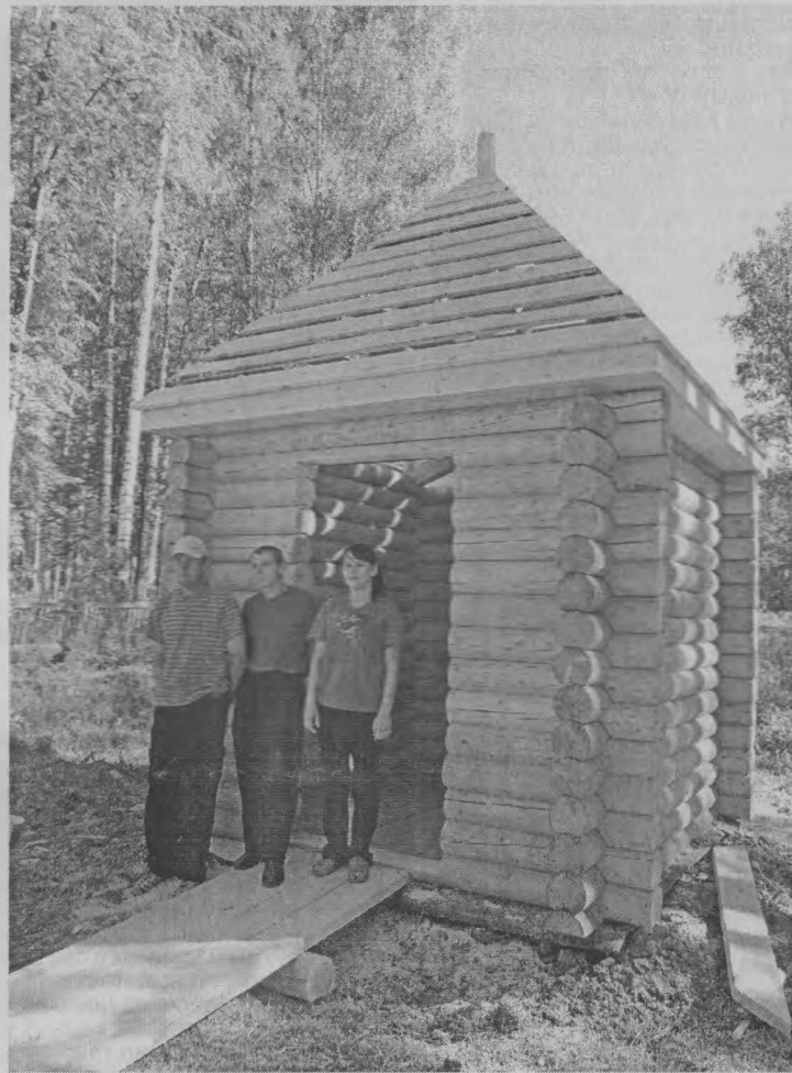
◆ На фоне строящейся часовни.

Александр Алексеевич, - спрашиваю я его, - назовите, кто Вам в этом благом деле помогает?