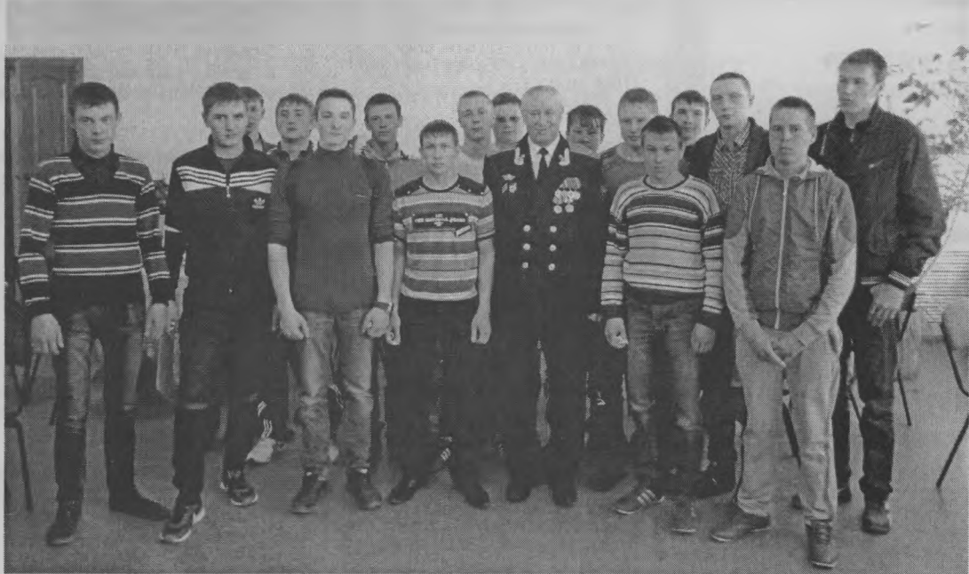
◆ Наши настоящие и будущие защитники.

Пятеро ребят из вашего района решили уклониться от службы. Их искали полтора месяца, но так и не нашли. Они обязательно будут подвержены наказанию за уклонение от мероприятий призывной кампании и воинской службы. Пусть им исполнится 27, 28 ... лет. В 27 лет они будут обязаны поменять документ воинского учета на во-