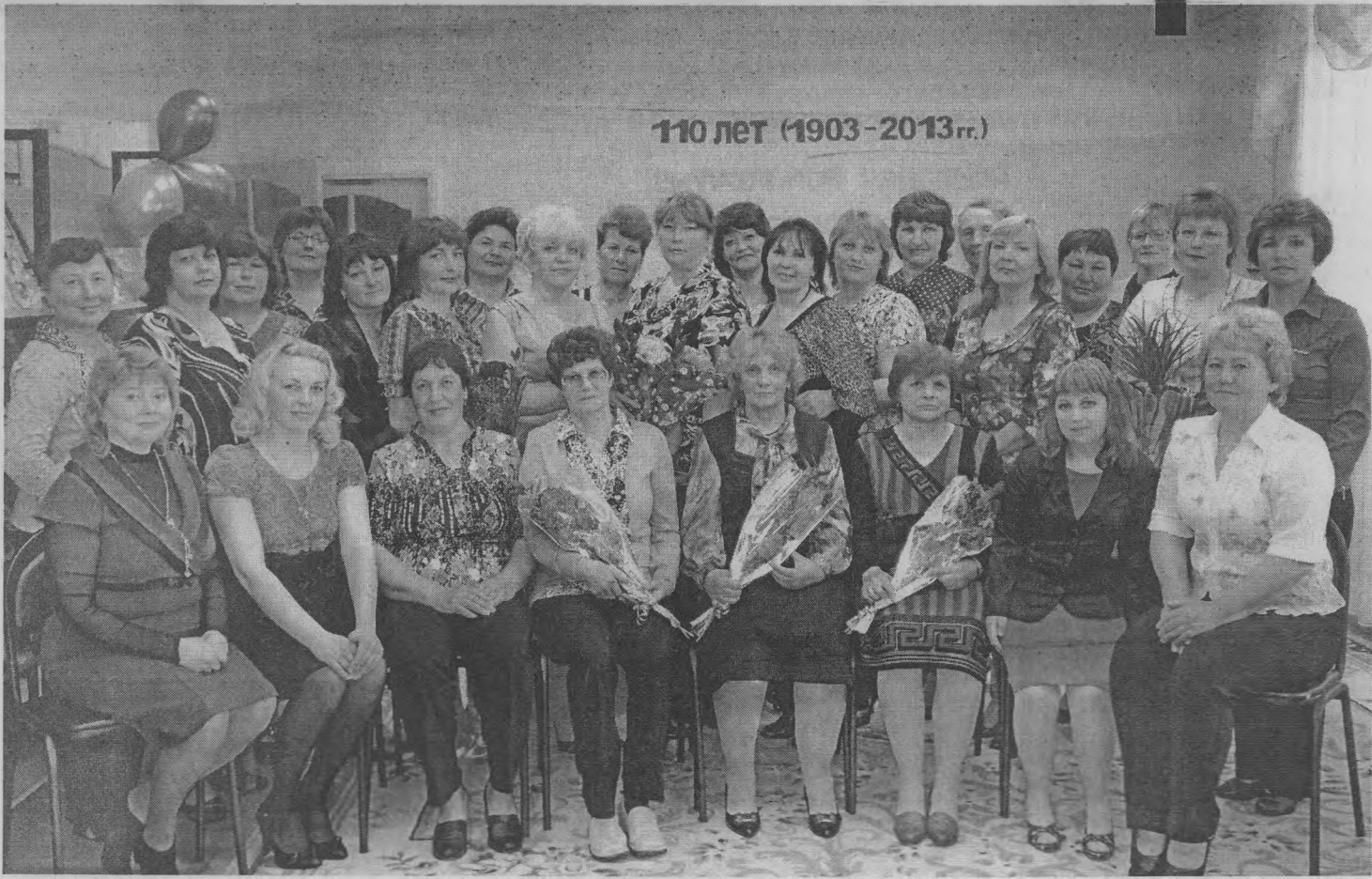
◆ «Работа наша, как солнышко: светит и нам, и людям».