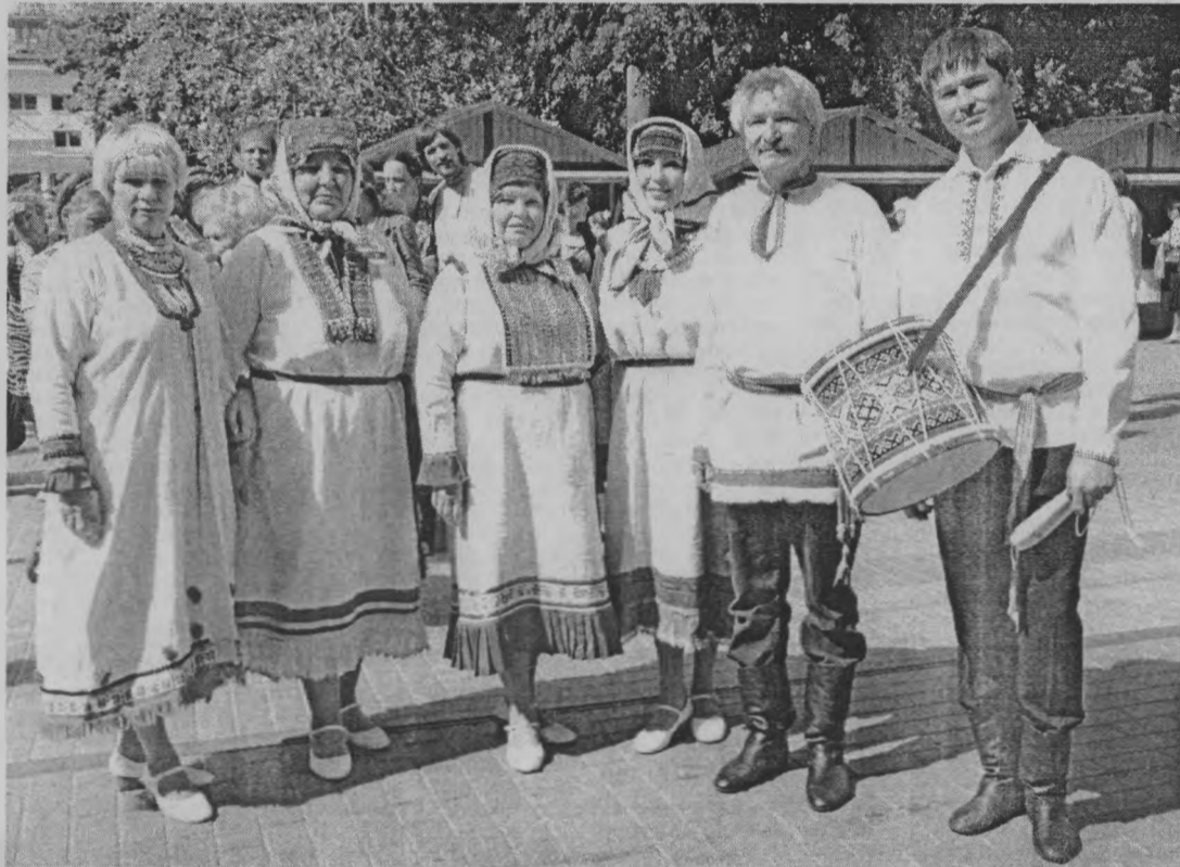
◆ На праздничной улице.