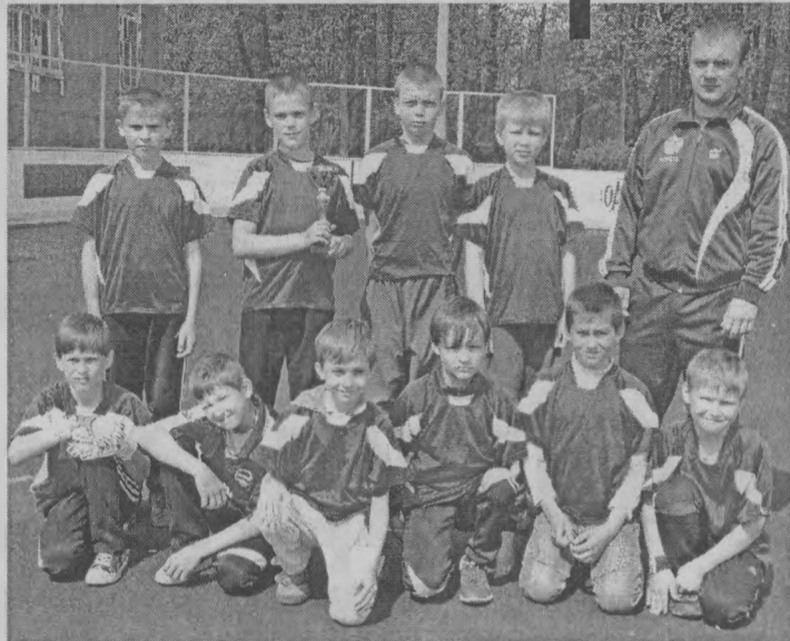
◆ Команда - победитель из Тоншаева.

Матчи младших футболистов имели такие результаты: в игре пижемской и шайгинской команд выиграла пижемская 2:1, противостояние тоншаевских и