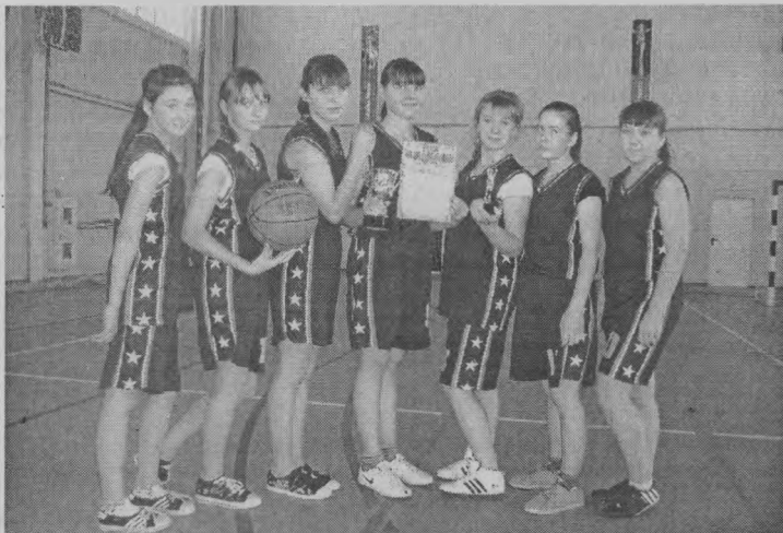
◆ Победившие в турнире.

В Шахунье прошло первенство северных районов области по баскетболу среди игроков не старше 15 лет.