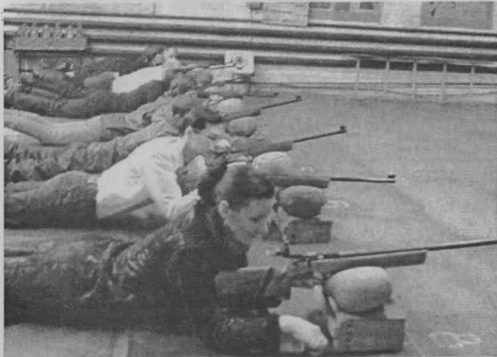
◆ Кто самый меткий стрелок?

В рамках массовых спортивных мероприятий на базе тира Нижегородского областного спортивно-стрелкового клуба прошли соревнования по стрельбе из малокалиберной винтовки. В них участвовали школьники и молодежь допризывного и призывного возраста.