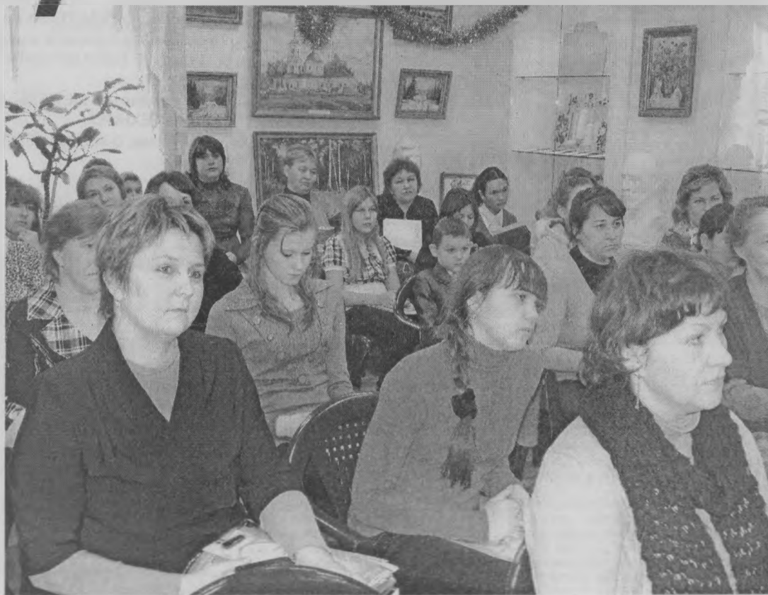
◆ Победители и призеры конкурсов.