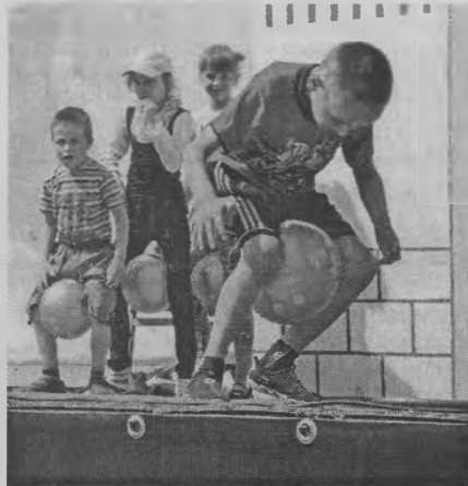
◆ «Еще прыжок, еще прыжок».

суббота. Стояла такая же солнечная и жаркая погода (зачастую природа в этот день не балует: бывает хмуро и пасмурно, а то и вовсе холодно и идет дождь, все-таки 1 июня – пограничный день, между еще вес-