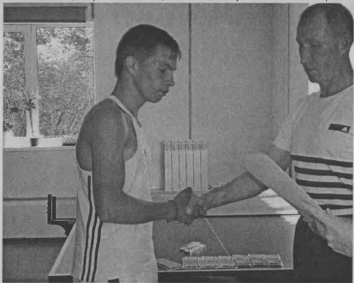
◆ Награждение призера кросса.