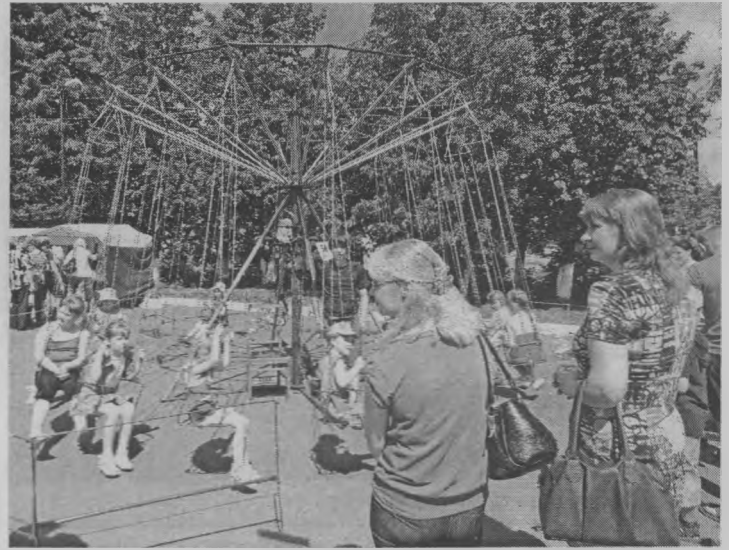
◆ «Карусель, карусель - это радость для нас».