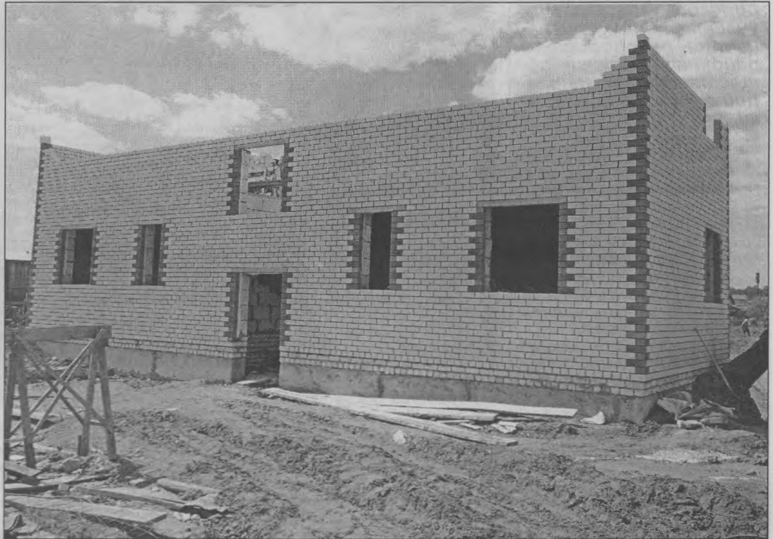
В поселке Тоншаево на улице Октябрьской, 56а, идет строительство двухэтажного жилого дома для детей-сирот. Строительство ведет ООО «МСО-Север». Дом восьмиквартирный и в конце лета должен быть сдан в эксплуатацию.