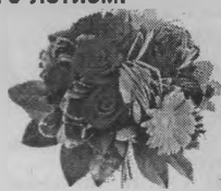
Жена, дети, внуки.