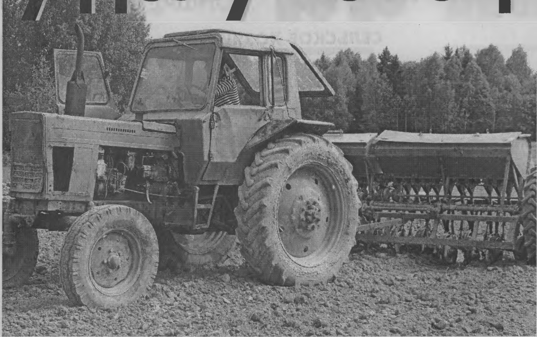
◆ На последних гектарах посевной.

поэтому механизаторы в течение всей посевной работали от зари до зари, без выходных и праздников. В последний день завершали работу тремя сеялками. Быстро затаривают семена в сеялки - и снова в поле. Никакой суеты. Конечно, многое зависит и от готовности к севу. Технику отремонтировали вовремя, топливом запаслись в полном объеме и заправляли трактора по полному баку. Семян достаточно. И механизаторы не подвели - справились с севом на 100 процентов.