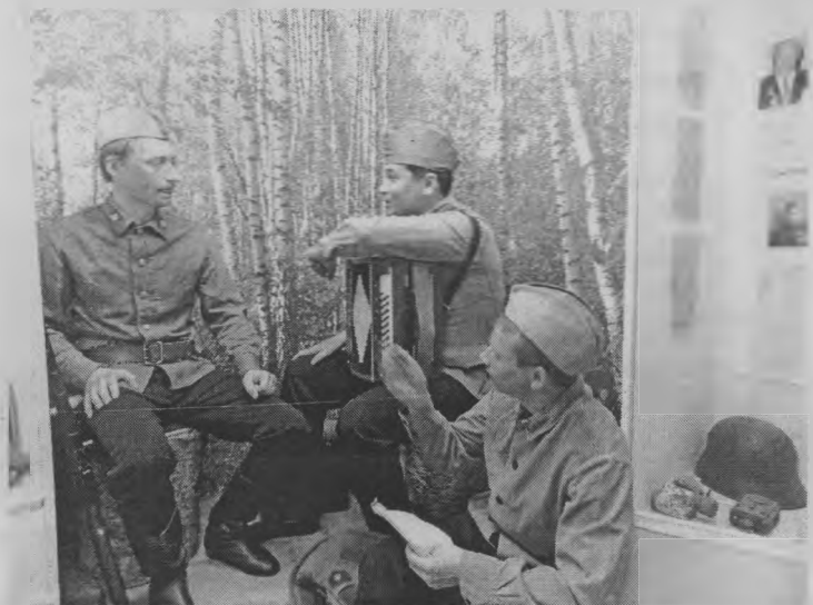
◆ «Споемте, друзья!».