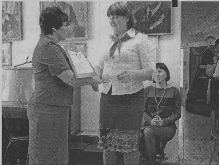
◆ За проявленную активность.

О том, что в нашем музее 18 мая происходило что-то необычное, можно было легко догадаться: двери и в самом деле были распахнуты настуж с 18 часов, а на всей прилегающей к музею территории наблюдалась непривычная суета. Гости подходили к назначенному часу, их приветливо встречали сотрудники, работающие здесь. И приглашали первым делом посетить выставку-загадку «Что это?» под открытым небом. Выставка та состояла из музейных экспонатов – старинных предметов быта. И требовалось вспомнить их правильное название. А тестировала