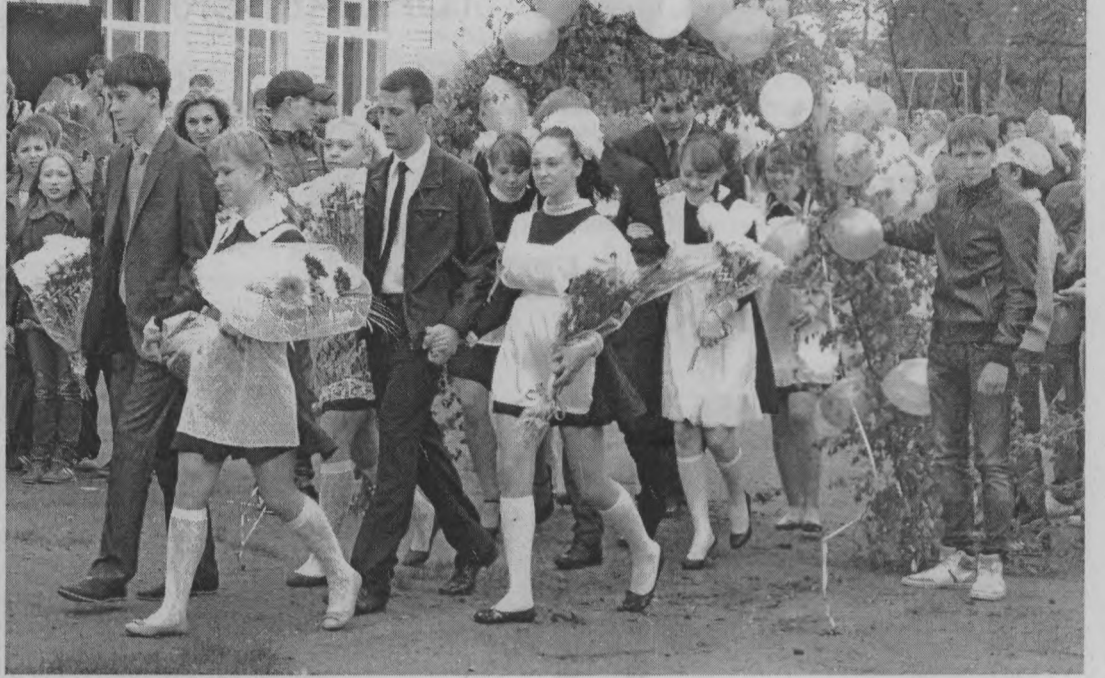
◆ Арка выпускников - фишка Тоншаевской школы.