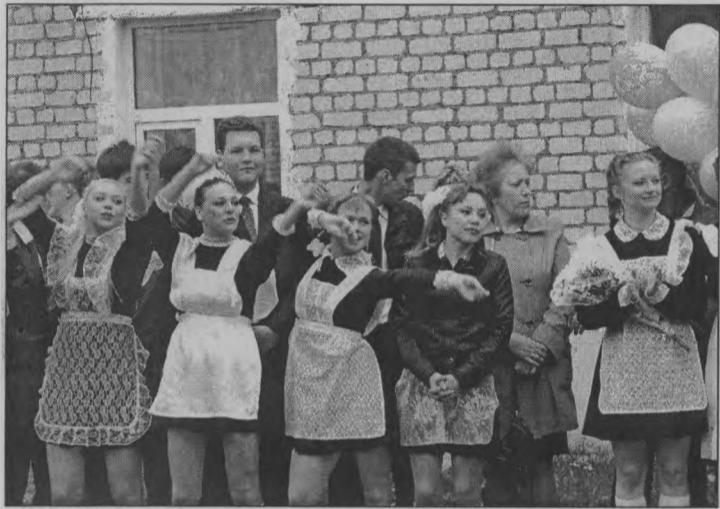
◆ До свидания, школа!

Я тоже так думаю. Об успехах многих ребят из этого выпуска наша газета писала не раз