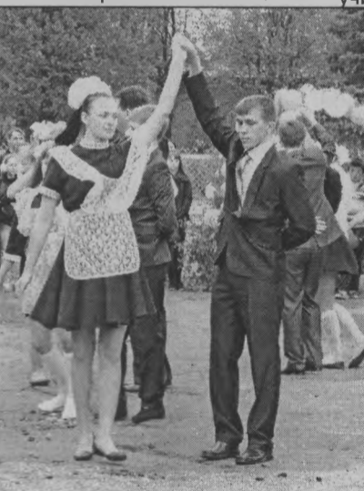
◆ Кружась в прощальном вальсе.