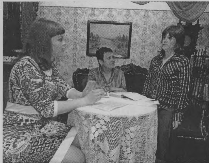
◆ Как прежде в комсомол принимали.

уроченные к этому событию, проходили до позднего вечера. И те, кто в этот день страдал «культурной бессонницей», смог насладиться музыкой, песнями из «Музыкального калейдоскопа». А под занавес этого праздника, в 22.00, было выступление шайгинских ребят, объединенных в музыкальную группу «Станция 699».