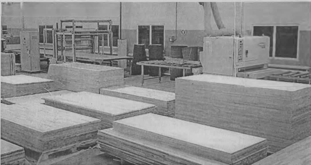
◆ ...участок финишной обработки фанеры.

- Приглашаем неравнодушных, работоспособных и ответственных молодых людей, как мужчин, так и женщин, к участию в этом интересном проекте в своём районе. Ещё есть время попробовать решить кадровый голод местными работниками, а не привлекать наёмную