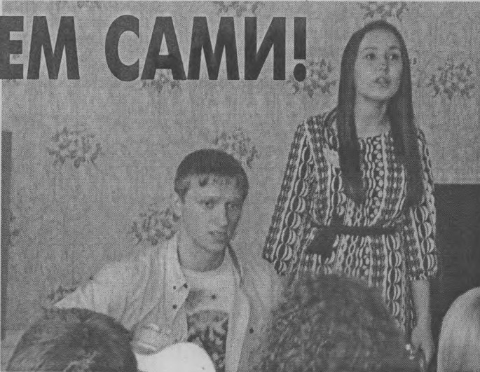
◆ Выступление Совета старшеклассников «Я-лидер» Тоншаевской школы.

Исполнительным органом школьного самоуправления является Совет, который осуществляет выполнение решений высшего органа самоуправления –