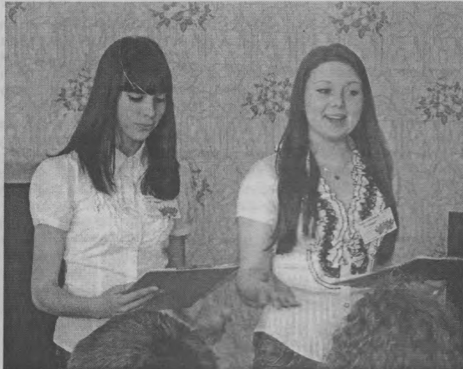
◆ Выступление Совета старшеклассников Буреполомской школы.

Собрания или Сбора, создает условия и реализует выполнение классами программы деятельности или плана работы.