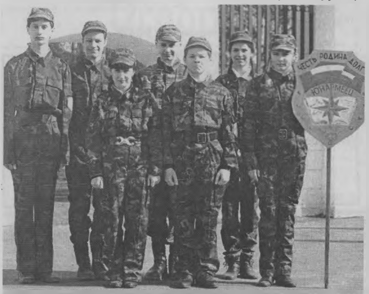
◆ Младшая команда.

В поселке Вахтан Шахунского района прошли дивизионные соревнования «Нижегородская школа безопасности-Зарница» среди северных районов области. В данном этапе соревнований принимали участие победители муниципального этапа соревнований - две команды МОУ Тоншаевская средняя общеобразовательная школа. Команды состояли из 7 обучающихся: 4 юношей и 3 девушек в возрасте 13-14 лет (младшая группа) и 15-16 лет (старшая группа).