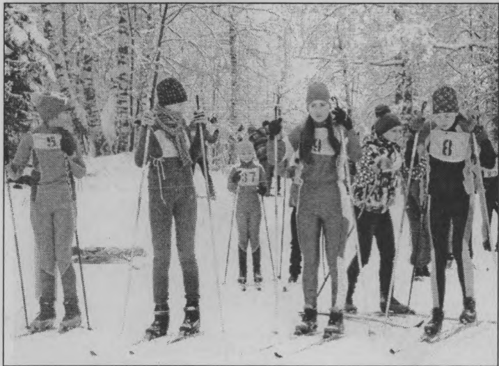
◆ На старте.