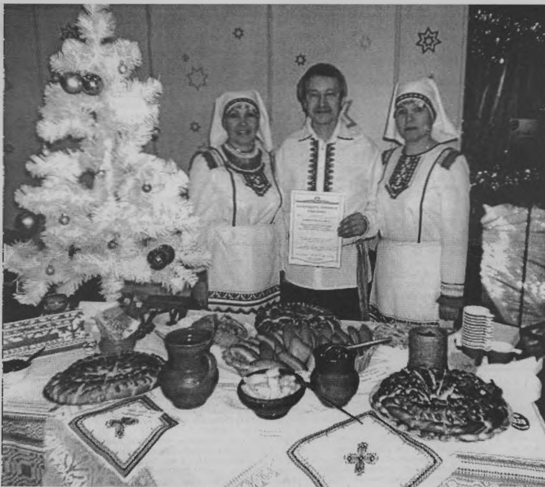
◆ «Милости просим к нашему столу!»

Мы угощали гостей праздника марийскими пирогами: с мясом и картошкой, грибами, сладкими, марийскими пельменями, пирожками, блинами, тоншаевскими пряниками. Также на нашем столе были мед,