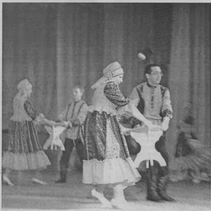
◆ Танцуют с табуреточкой.