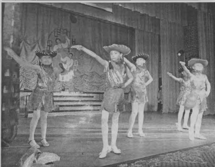
◆ «Вечный двигатель» из Буреполома.

чены дипломы и подарки. Калейдоскоп получился! Один танцевальный узор был красочнее, интереснее, не-