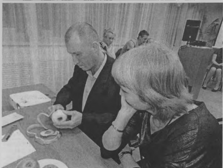
◆ Ювелирная работа!

ваться бесплатным Интернетом, узнать, как стать виртуальным читателем, познакомиться со всеми сервисными услугами библиотеки.