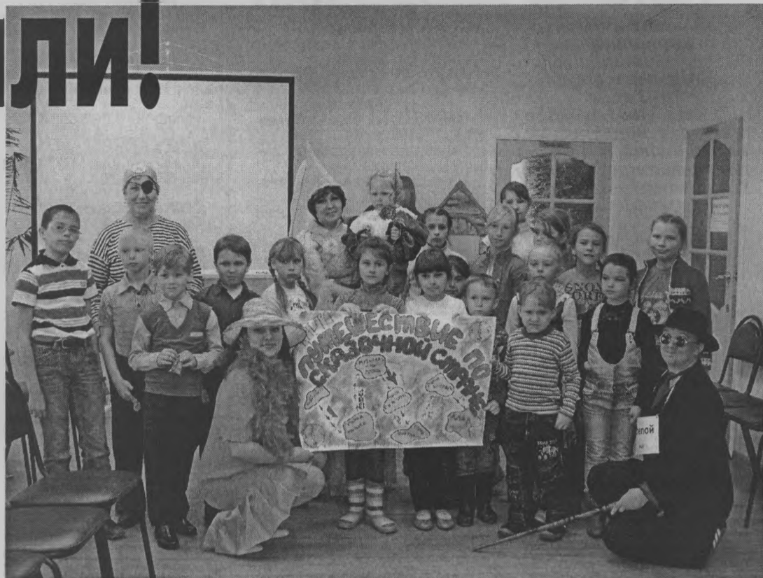
◆ Из дальних странствий возвратись.

Но вот и окончен бал... Погасли свечи. Но ночь-то еще не завершилась! И ее продолжением стала викторина, посвященная лермонтовским героям. А еще в этот необычный вечер можно было попробовать бутерброды, приготовленные по рецептам времен Лермонтова.