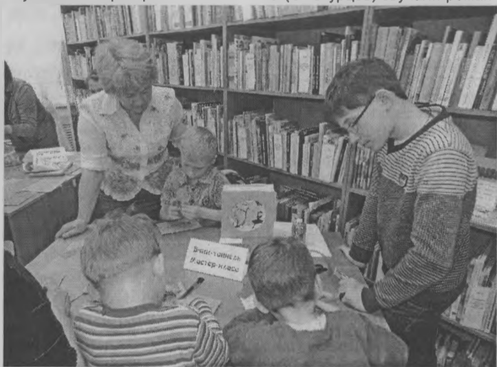
◆ Под чутким руководством мастера.