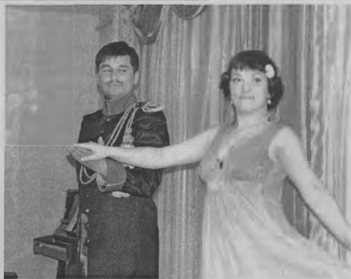
◆ На балу с М. Ю. Лермонтовым.

Всю ночь напролет на большом экране телевизора демонстрировались буктрейлеры – видеоролики, вкратце рассказывающие о таких произведениях, как «Маленький принц», «Алиса в стране чудес», «Вечера на хуторе близ Диканьки», «Тихий Дон», «Война и мир». Кстати, часть из них создана читателями и библиотекарями района. Работали книжные выставки: «Неисчерпаемый мир Лермонтова» - о жизни и творчестве классика, и «Мои любимые детективы», где были представлены золотая классика этого жанра, а также иронические, остросюжетные, любовные, полицейские, авантурные и CLIO- детективы. Предлагалась возможность воспользо-