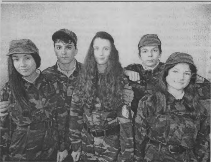
◆ Победители - тоншаевские юнармейцы.

второе место досталось тоншаевцам, третье – отряду из Гагаринской школы. Среди старших команд места заняли: первое – из Тоншаевской школы, второе – Пижемской, третье – Буреполомской.