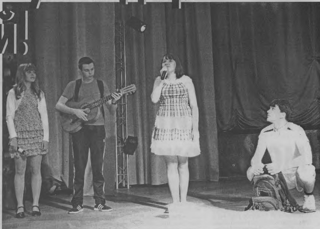
◆ Победил «Позитив».