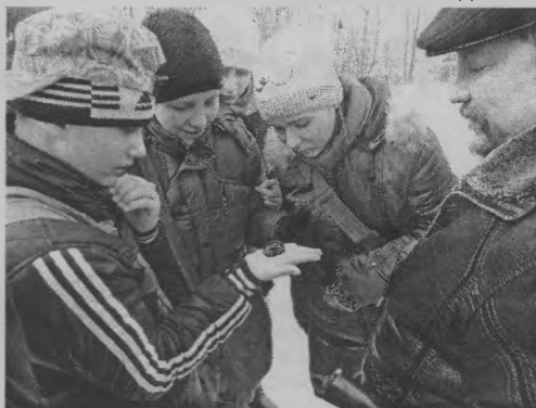
◆ «Ну, компас, «скажи», где север?»

ку-разборку автомата, стрельбу из него по мишени и силовую гимнастику: девушки отжимались, юноши подтягивались. Участники соревнований достаточно успешно закончили все предложенные увлекательные виды соревнований, где им очень помогла полученная теоретическая подготовка по ОБЖ.