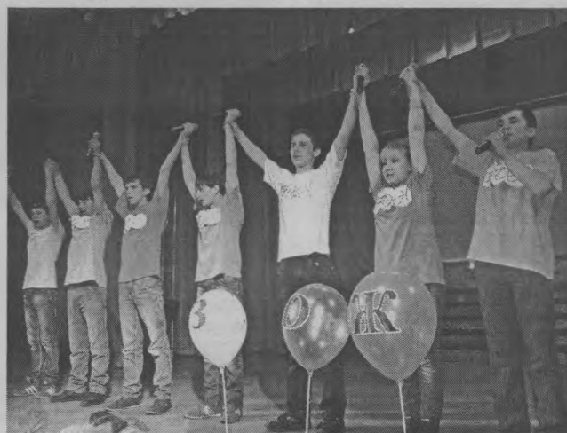
◆ Энергичные ребята особого назначения.