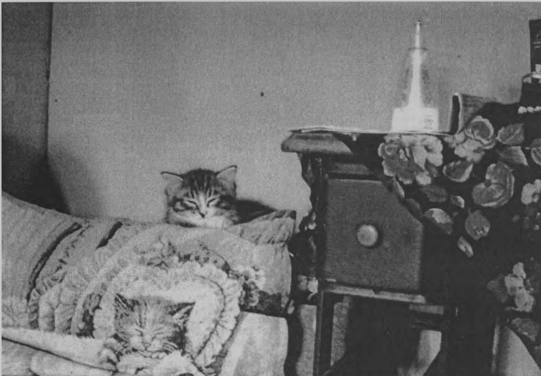
◆ Тише, дети, не шумите, Тишкин сон вы сохраните.