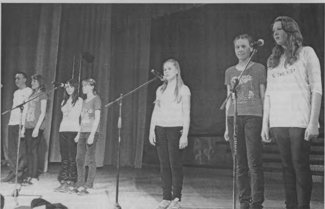
◆ Письменерская «Мечта».

Данный конкурс волонтерских агитбригад, направленный на формирование здорового жизненного стиля, проводился второй раз. Традиция, зародившаяся в прошлом году, продолжается! Вот бы благодаря ей у нас появлялось все больше и больше желающих подружиться со спортом, внимательных к своей жизни и здоровью, равнодушно проходящих мимо вредных привычек.