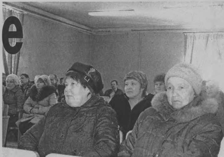
◆ ...зал слушал с интересом.

Участники общего собрания должны были определиться по четырем позициям. Первое – участвовать или не участвовать в проекте? Тут разногласий не было – участвовать. Второе – решить, что именно нужно сделать на территории поселения. Мнения высказывались различные – и это хорошо. Значит, людям не все равно, как живет поселение. Были предложения по реставрации церкви, по восстановлению пруда, по обустройству пляжа. Были даны комментарии по каждому предложению: по церкви письма с ходатайствами уже направлены. Восстановление пруда требует большой подготовительной работы. Это гидротехническое со-