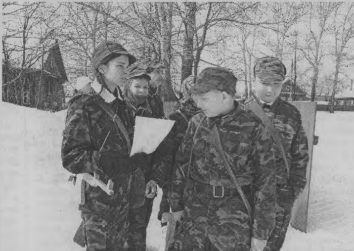
◆ Ориентируясь на местности.

Так случилось, что две младшие команды – Тоншаевской и Лесозаводской школ набрали одинаковое число очков. Но у пижемских ребят лучший результат оказался при выполнении «срочного донесения». И именно они стали лидерами. А