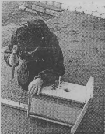
◆ Последний гвоздь, и скворечник готов!

Нынешней зимой регулярно расчищали ледовую площадку