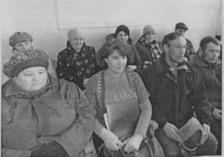
◆ Местная инициатива - это инициатива жителей!

Участие Увийского сельсовета в реализации пилотного проекта местных инициатив обсуждалось 5 апреля на сходе жителей, который прошел в Доме культуры в Больших Селках.