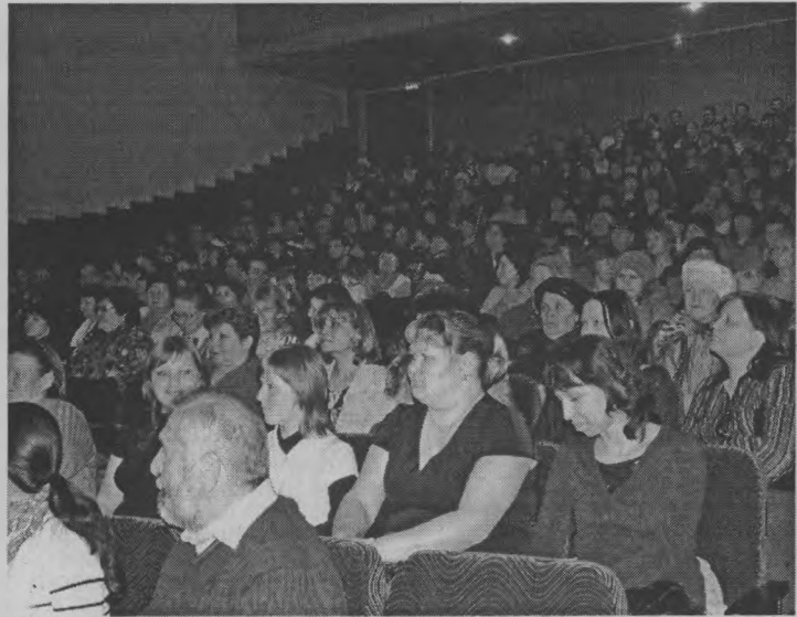
◆ Полный зал неравнодушных людей.

осталось очень хорошее. Полный зал людей. И это не угрюмые лица, а очень заинтересованные, неравнодушные люди. Есть понимание и доверие к власти. Поддержка населения - это ключ и залог успешной реализации проекта. Уверен, что в вашем районе обязательно будет положительный результат. И проект будет жить».