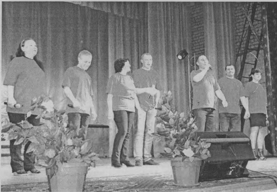
◆ Приехал «Вовик» из Шерстков...

Очень хочется сказать о составе команд. Исключительно во всех из них были такие участники, которые буквально заряжали своим задором, оптимизмом, позитивной энергией и жизнелюбием. А главное, что просто необходимо на сцене, обладали большим артистизмом. Им порой хватало лишь мимики и жестов, чтобы расшевелить публику. А это не каж-