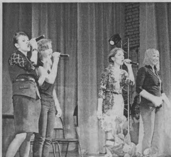
◆ Тоншаевский «Мулен Руж».

Решающим, как всегда, стал последний конкурс – домашнее задание. Оно называлось «Бегут ручьи». Здесь команды выложились по полной. Показали все, на что они способны, и даже больше. Вот уж где были представлены проблемы, что называется, на злобу дня. И с ориентиром именно на наш район. Особенно в этом отличились Шерстки. Молодцы! КВН и должен быть таким. Не только веселым и развлекательным, но и содержащим критику, обличающим пороки и недостатки. Имеет смысл иногда посмотреть на себя со стороны. Без обид. «Вовик» инсце-