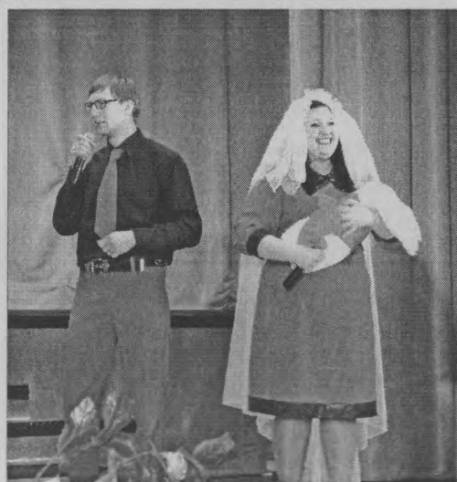
◆ «Мы из «Спарты!».

В первом конкурсе – визитке «Пора любви» они больше всех баллов присудили «Спарте». Думаю, потому, что эта команда сразу начала с освещения проблем, характерных для нашей местности. На балл от нее отстал «Вовик». А шайгинцы и тоншаевцы, по оценке жюри, оказались на одном