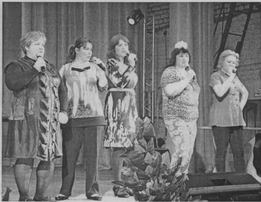
◆ Шайгинский «Женсовет».

шее значение имели: этика и эстетика, оформление (техническое, художественное, музыкальное) выступления, новизна и актуальность представления. Учитывалось отсутствие плагиата с телевизионных передач. Да еще как! За его наличие обещалось снижение баллов. А главное – необходимо было обыграть проблемы и вопросы, касающиеся нашего района.