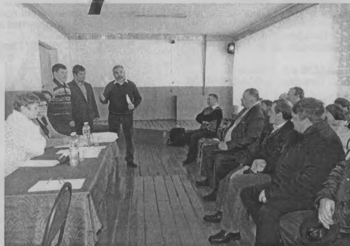
Во время обсуждения проекта.

Любое дело требует финансовых затрат. А проект интересен и привлекателен тем, что для решения проблемы привлекаются деньги из различных источников: основной – 87 про-