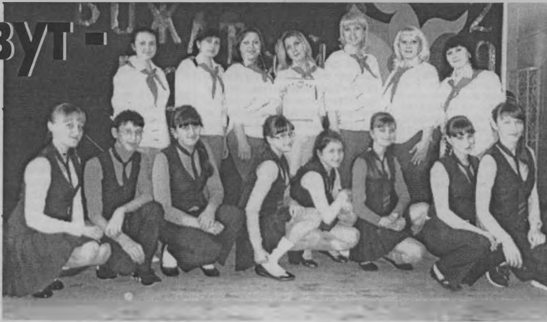
◆ Вожатский отряд с «Детями XXI века».

Конкурс состоял из трех этапов: выступлений старшей вожатой с детским объединением, отрядов старших вожатых и соревнований в виде презентаций районных детских общественных объединений - у нас в районе это районный Союз детских объединений «Ровесник». Все категории участников показали достойный результат.