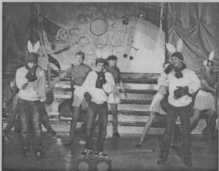
◆ «Зайцы» из «Мятого севера».

Записала Н. КИВЕРИНА Фото с районного фестиваля «Маленькая страна».