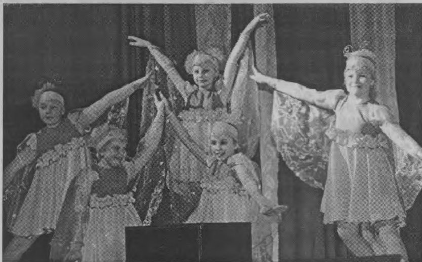
◆ «Бабочки» из «Созвездия».

Как всегда, конкуренция была сильная. Все руководители готовились к этому фестивалю очень серьезно. И то, что наши юные артисты и их руководители конкурируют с город-