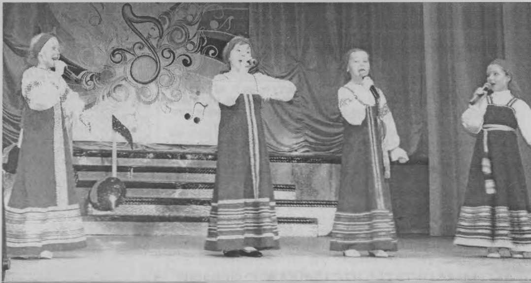
◆ Вокальная группа ансамбля «Скоморошинка».

Старшая группа этого коллектива также завоевала призовое место. Она стала третьей