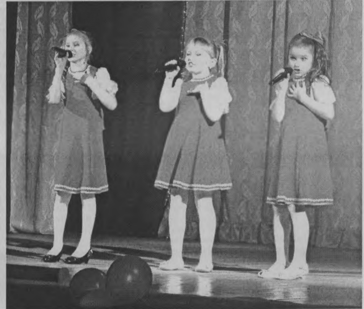
◆ «Три подружки» из Кувербы.