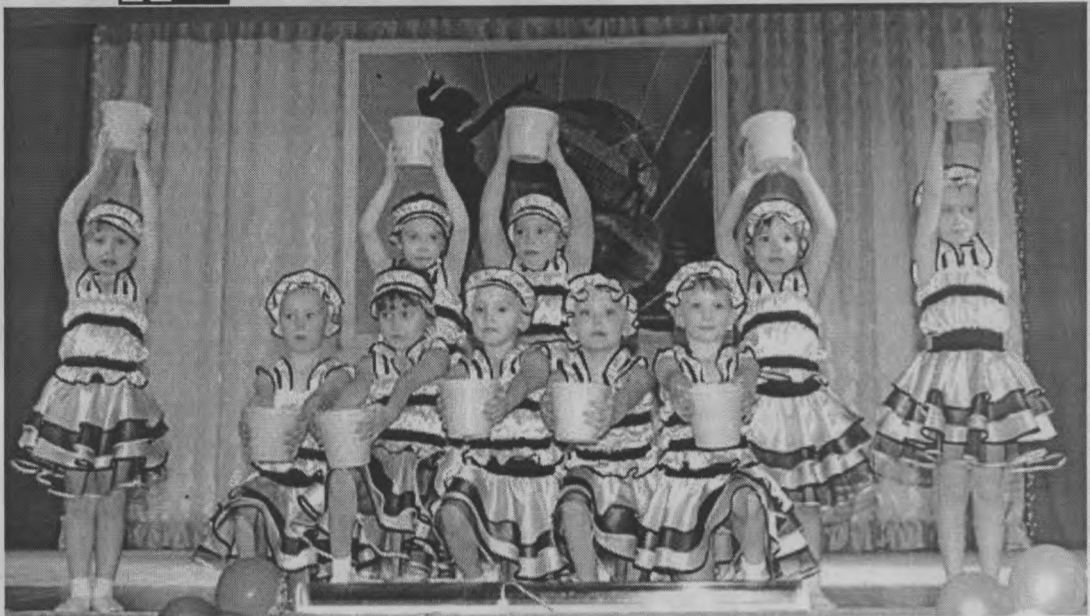
◆ Маленькие «Пчелки» со своей ролью справились замечательно!

Конечно, все волновались, переживали: и артисты, и их наставники. И зрители, ведь большинство из них - мамы, папы, бабушки, старшие и младшие братья и сестры, друзья... Конечно, похвалы заслуживают все участники без исключения! Кто-то уже бывалый артист, не