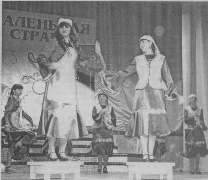
◆ Шайгинские «татарочки».