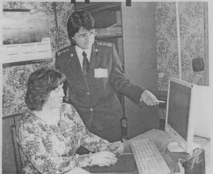
Налоговая декларация представляется налогоплательщиком в налоговую ин-

Если перечисленные налогоплательщики не представляют в срок налоговую декларацию до 30.04.2013 года, то им начисляется штраф в соответствии со ст. 119 НК РФ.