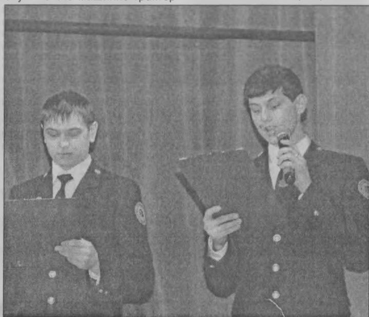
◆ Студенты Краснобаковского лесного колледжа.