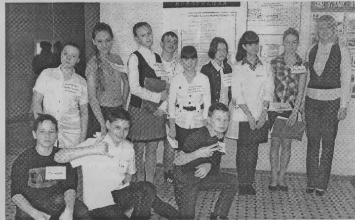
◆ После «Суда над проступками».

- Этот закон противоречит нашей Конституции. С помощью него будут изыматься дети из благополучных, а главное – здоровых семей. Если, допустим, у семьи нет необходимых средств для жизни, государство должно помочь ей, а не лишать ее детей. Ювенальная юстиция стимулирует то, чтобы дети подавали жалобы на своих родителей, доносили на них в правоохранительные органы. Ребенок по этому закону будет сам решать: слушать ему или нет родителей. Нельзя будет навязывать детям свое мировоззрение, воздействовать на них ни психологически, ни фи-