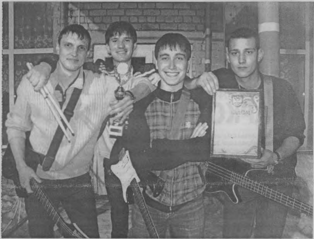
◆ «Первое место - за нами!»

- Нам очень понравилось. Была дружелюбная атмосфера среди участников. Так получилось, что мы приехали только со своими гитарами, без остальной нужной для выступления аппаратуры. Но нас выручили другие группы, помогли нам с комбоусилителями, железом для барабанов. Нам сказали, что пригласят