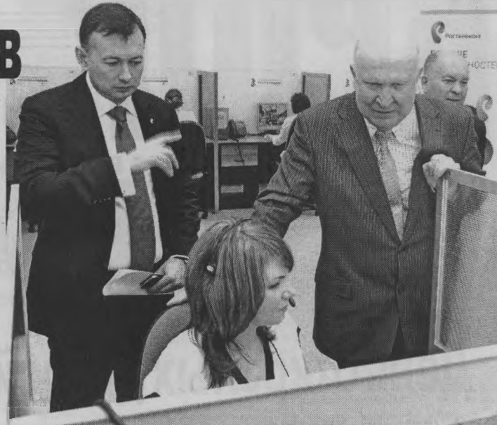
♦ Работа оператора горячей телефонной линии.

Отметим, что месячники по борьбе с наркоманией проводятся в Нижегородской области с 2005 года и уже стали традиционными. Благодаря просветительской работе, спортивным и общественным мероприятиям число наркоманов в Нижегородской области, по статистике, в 1,5 раза ниже среднероссийского показателя (189 наркоманов на 100 тысяч населения против 247 нарко-