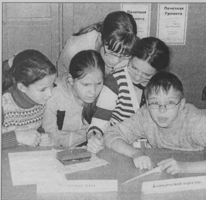
◆ Азартный предмет - экономика.

В первом конкурсе для приобретения лицензии нужно было правильно ответить на