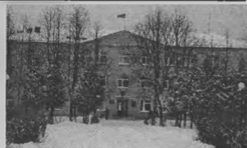
Многофункциональное информационное центра.

Ю. Н. Михалицын отметил, что призывная кампания в районе прошла организованно. Начинается приписная кампания. Также заострил внимание на подготовке помещения под разме-