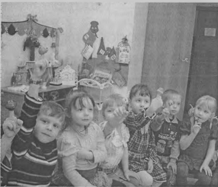
◆ Пальчики превращаются...

Рука настолько связана с нашим мышлением, с переживаниями, трудом, что стала вспомогательной частью нашего языка. Например, когда мы о чём-то рассказываем, мы не