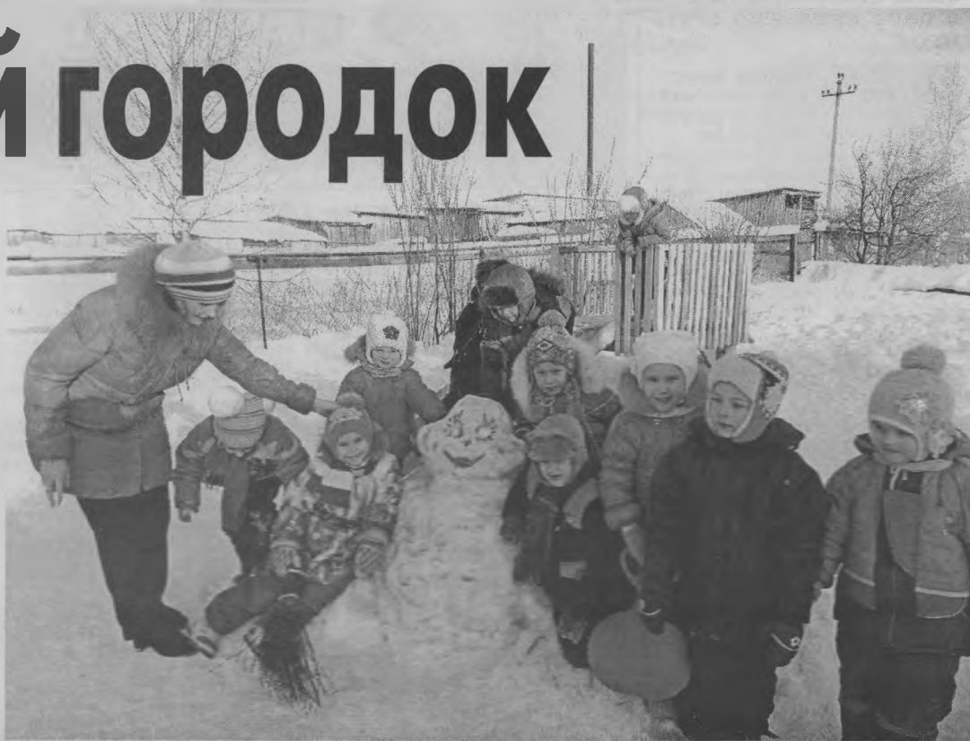
«Хотим сфотографироваться у лягушки».

И правда, куда ни поверни голову на территории «Колоска», везде снежные фигуры. Прямо сказочный городок из