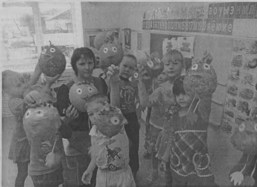
◆ «Это наши чудо-птички!»

И в 10 лет, и в 7, и в 5 Все люди любят рисовать. И каждый смело нарисует Все, что его интересует, Все вызывает интерес. Далекий космос, Ближний лес, Цветы, машины, Сказки, пляски... Все рисуем, Были б краски,