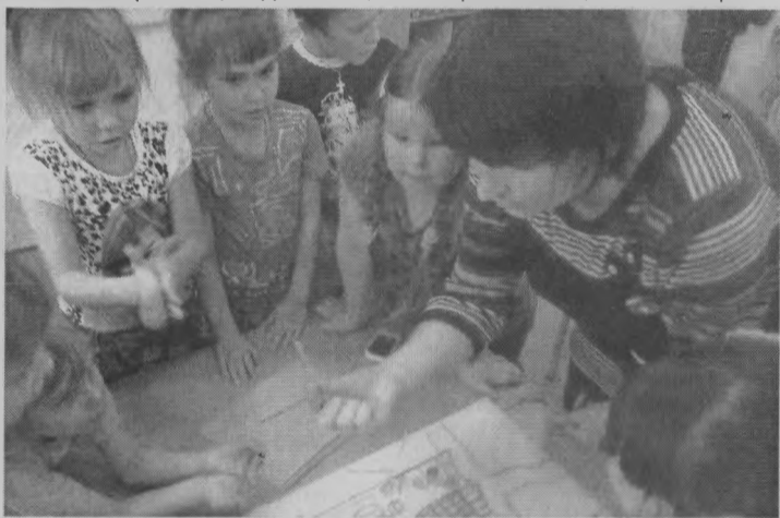
◆ Во время творческого процесса.

Работая с детьми по теме «Использование нетрадиционных техник рисования в работе с дошкольниками», я стараюсь не только показать новый способ рисования, но и постараться