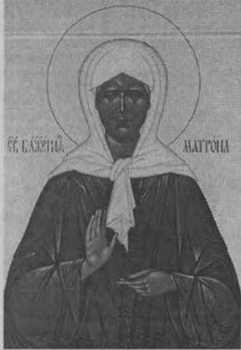
ронушка - Бог, что ли? Бог помогает!"

Молитвы матушка читала всегда громко. Она подчеркивала, что помогает не сама, а Бог по ее молитвам: "Что, Мат-