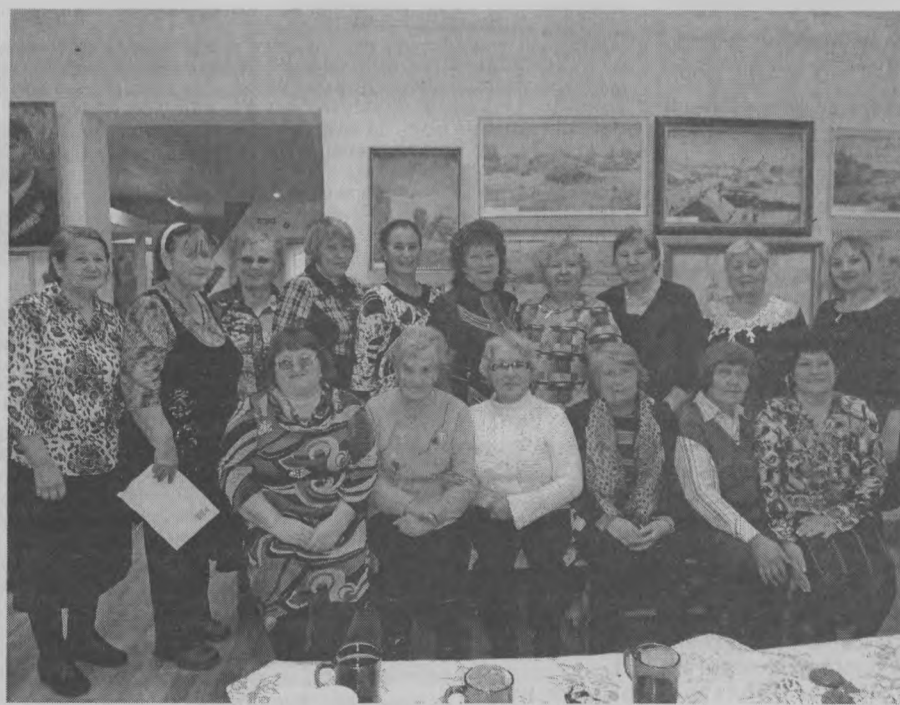
◆ На встрече участниц выставки.