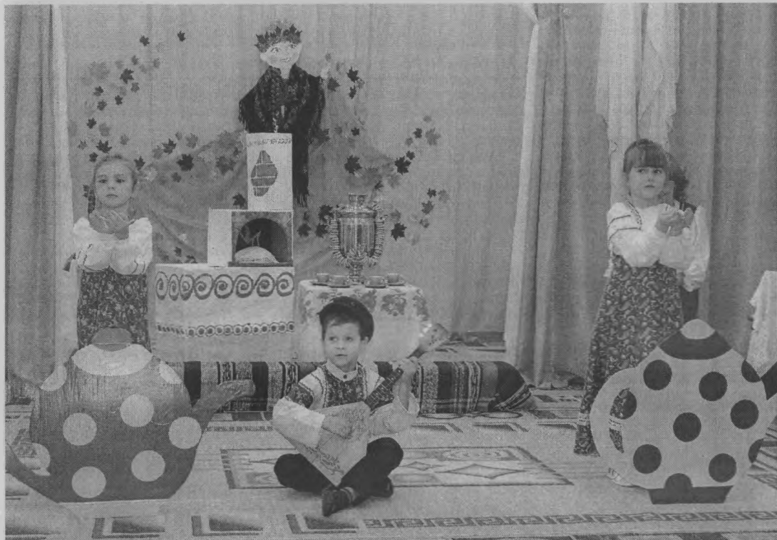
◆ Тренди-бренди, балалайка...

Старшие дошкольники в русских народных костюмах приходят в горницу к Хозяйке на посиделки, которые богаты русскими народными играми, хороводами, обрядами и народными драматическими действиями - сценками и кукольными спектаклями. Игровое действо насыщено пословицами и поговорками, прибаутками и загадками. Дети с удовольствием проявляют свою ловкость, силу, внимание и сообразительность в интересных и содержательных народных играх: «Лавочка», «Дрема», «Горелки» и других. А какой же фольклорный праздник без ярких, звонких деревянных ложек - радости всех ребят. Игра