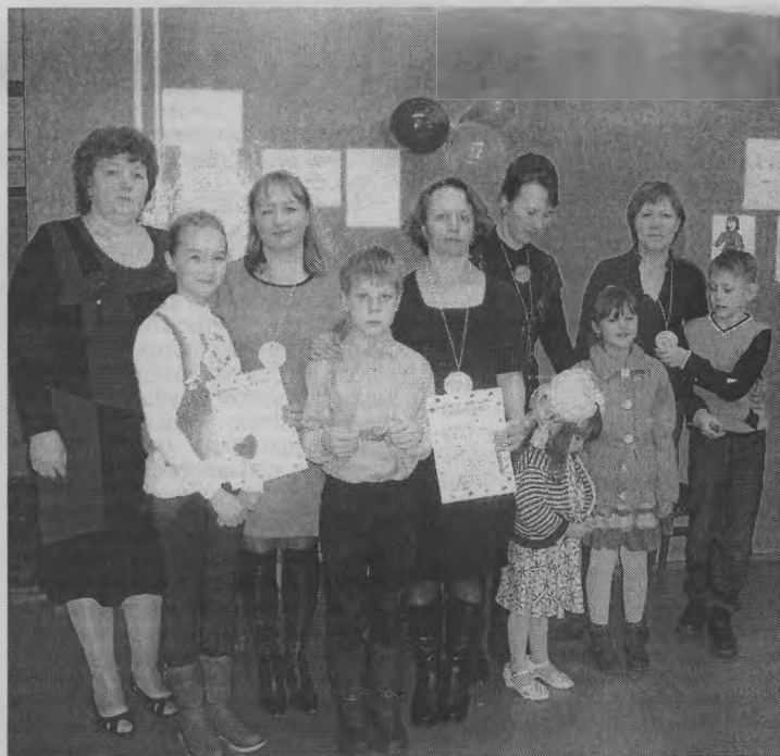
◆ Мамы и дети - это одно целое.

КВН закончился дружбой. Иначе и быть не должно, ведь мамы и дети - это одно целое. Дети вручили мамам медали «Моей любимой мамочке за доброту и нежность, терпение и надежность!» и подарили