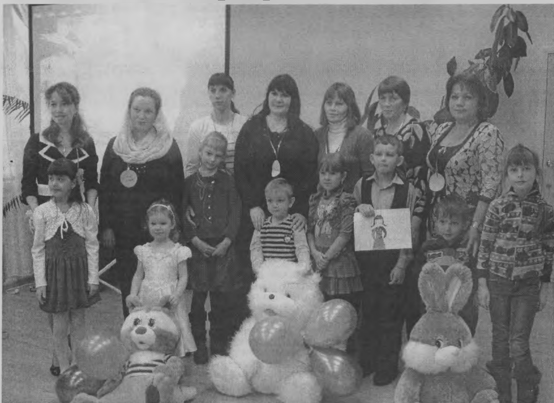
◆ В самый важный день.

Прекрасен опыт материнства! Быть мамой женщине дано, Любви и мудрости единство В ее душе заключено.