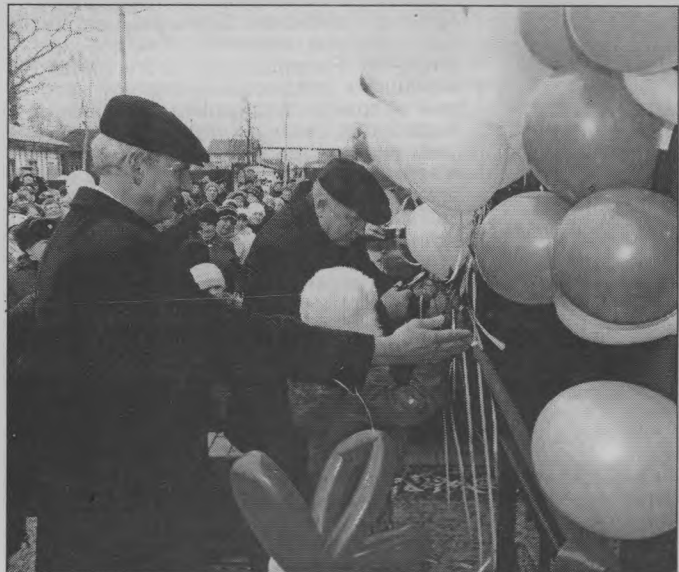
◆ Еще миг, и садик открыт!