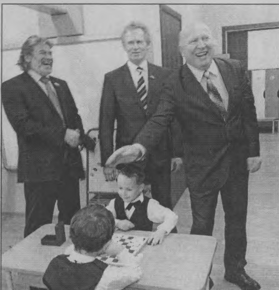
◆ «Молодец! Продолжай в том же духе!»