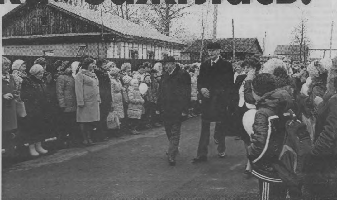
◆ Рады видеть губернатора.