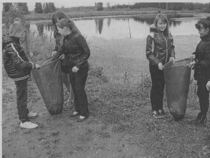
◆ «Давайте не будем устраивать здесь свалки!».