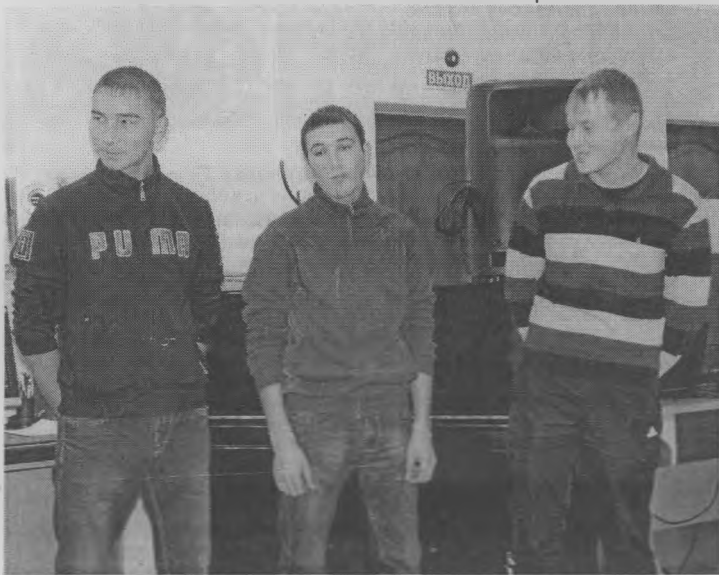
◆ Перед очередным веселым конкурсом.