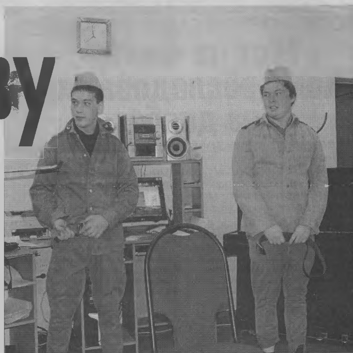
◆ Форма - к лицу.

Запомните: в армии забывают слабых и неумелых. Так же, как в школе, в институте... А гибнут ребята из-за своей лени, нерасторопности, недисциплинированности. Нужно соблюдать меры безопасности и не совершать самовольных поступков. Живите по уставу. Строгих и справедливых вам командиров! Если такие будут, значит, будет порядок. Самое главное - вернитесь домой здоровыми.