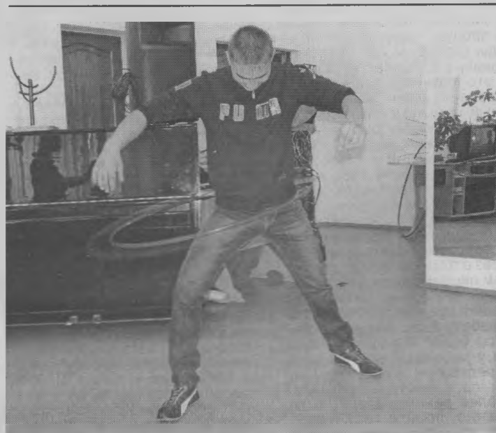
◆ Крутить обруч - ерунда!

Вместе с ведущей мероприятия Н. Юдинцевой новобранцы представили один день службы в армии: на время надевали и снимали форму, делали зарядку: принимали упор лежа и отжимались, крутились, как белки в колесе, точнее, в обруче, ели наперегонки солдатскую кашу, пели хором отрядную песню... Было смешно и весело. Вот бы каждый день так в армии проходил! С шутками да прибаутками.