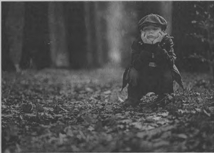
◆ Настроение? Осеннее....