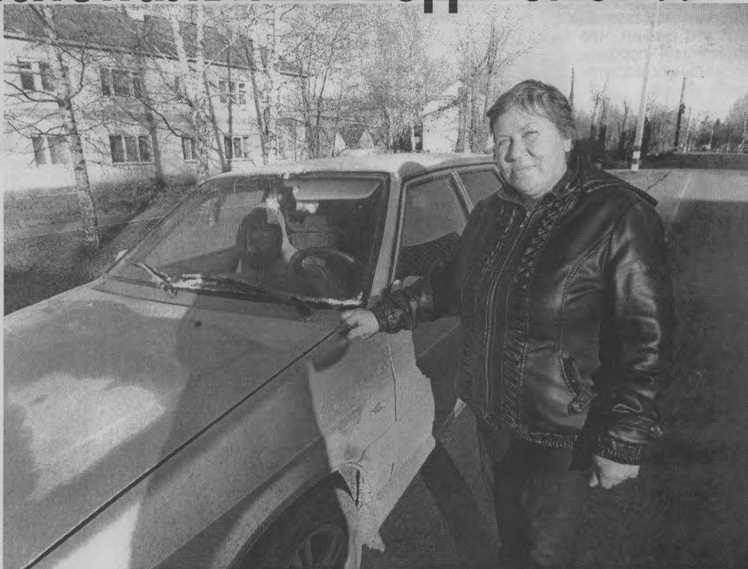
◆ «Без машины я никто».