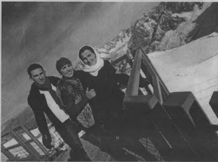
◆ Фото из поездки по Швейцарии.

поняли друг друга. А потом еще и понаблюдала, как прямо в поле приехала доильная установка. Подоили коров - и машина отбыла. Чудеса, да и только! Конечно, сразу же вспомнилась милая сердцу Куверба.