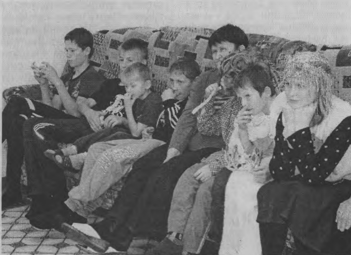
◆ «Интересная получается сказка».

правонарушение, более-менее знают. А это вселяет надежду, что, может, подумают, прежде чем совершить какой-либо проступок. А для закрепления полученной информации таких встреч с добавлением примеров, особенно из местной жизни, должно быть как можно