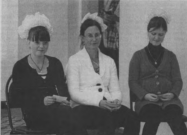
◆ Три девицы под окном.

символические названия: Похмелье, Цигарка да Наркомафия.