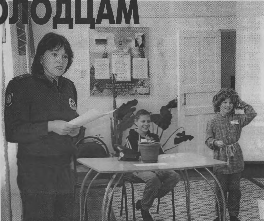
◆ «Вы послушайте, ребята, мы хотим вам рассказать...».

Что ждет тех, кто появляется в состоянии опьянения в общественных местах? Или распивает спиртные напитки? А если курит? На такие и подобные им вопросы следовало дать ответы юным жителям детского дома. И они отвечали. Причем в основном правильно. Значит, с законами, касающимися их, знакомы. И что им грозит за то или иное